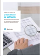
#6 Dolandırıcılık ve Sahtecilik