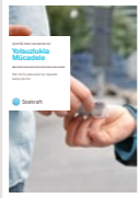
#1 Yolsuzlukla Mücadele