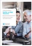
#7 Gizlilik ve Bilgi Yönetimi