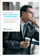
#4 Çıkar Çatışması ve Adil Rekabet