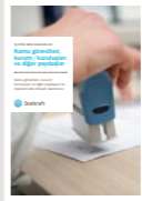
#3 Kamu görevlileri, kurum / kuruluşları ve diğer paydaşlar